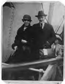
パミューダのロータリー会館を訪問後、船に乗るポール・ハリスとジョン夫人、1925年