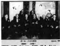
ロータリークラブ誕生のメンバー