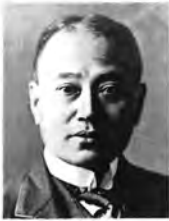
三井信託銀行社長時代