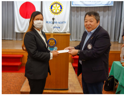
アニスさんに奨学金を支給